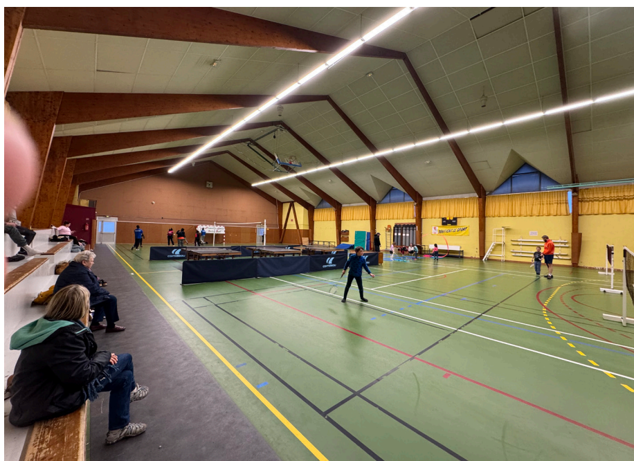
Soirée Sports en accès libres en avril dernier

Vendredi 24 octobre : vous pourrez aussi aller dans la