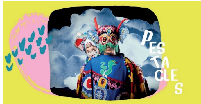
© La fête farfelue du monde pointu

Ce spectacle musical est une célébration dansante et colorée d'un monde joyeux et totalement farfelu. Une fête entre électro et musiques traditionnelles, où l'on danse, chante, crie, tape des pieds dans un grand exécutoire aux influences tzigane, pygmée, gnawa, maloya, électro-