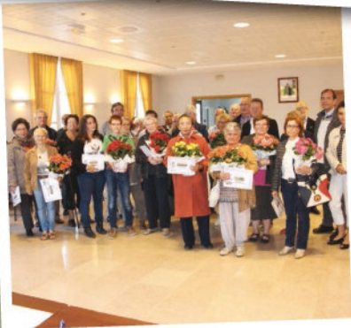
Maisons fleuries 2 octobre 2015