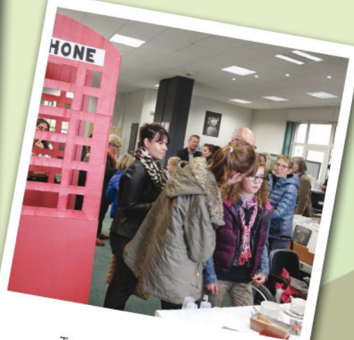
Tea time à la médiathèque 14 octobre 2015