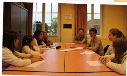
Réunion du Conseil Municipal des Ados