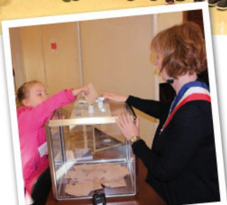
Élections du 9 octobre