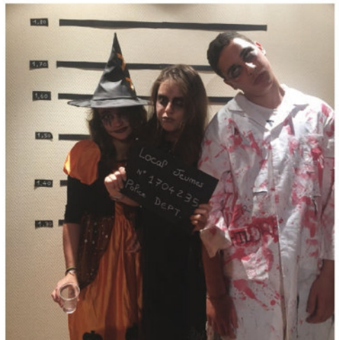
Halloween Local Jeunes 30 octobre 2015