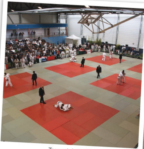
Tournoi de judo 10 octobre 2015